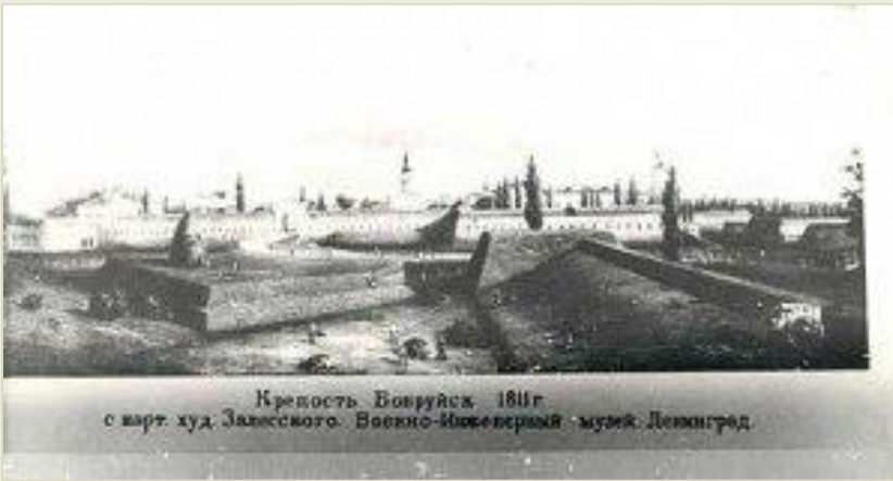
Крепость Бобруйск 1811г. с карт. худ. Зависского. Военно-Исторический музей Ленинград.

С Бобруйском связаны события декабристского движения в России. В крепости была расквартирована 9-ая пехотная дивизия, среди офицеров которой были члены тайных обществ. Именно здесь в мае 1823 г. был разработан «Бобруйский план» вооружённого