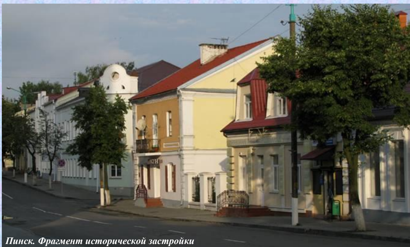
Пинск. Фрагмент исторической застройки