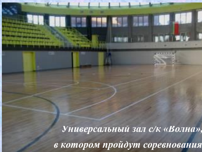
Универсальный зал с/к «Волна», в котором пройдут соревнования