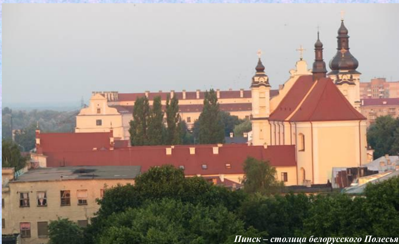
Пинск – столица белорусского Полесья