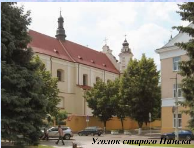
Уголок старого Пинска