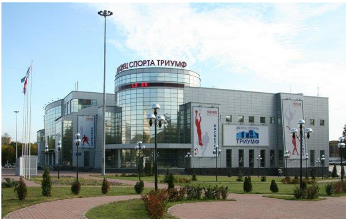
Вид спортивной арены Дворца Спорта "Триумф"

Дворец Спорта "Триумф" Московская область, г. Люберцы, улица Смирновская, дом 4 https://www.dstriumpf.ru/