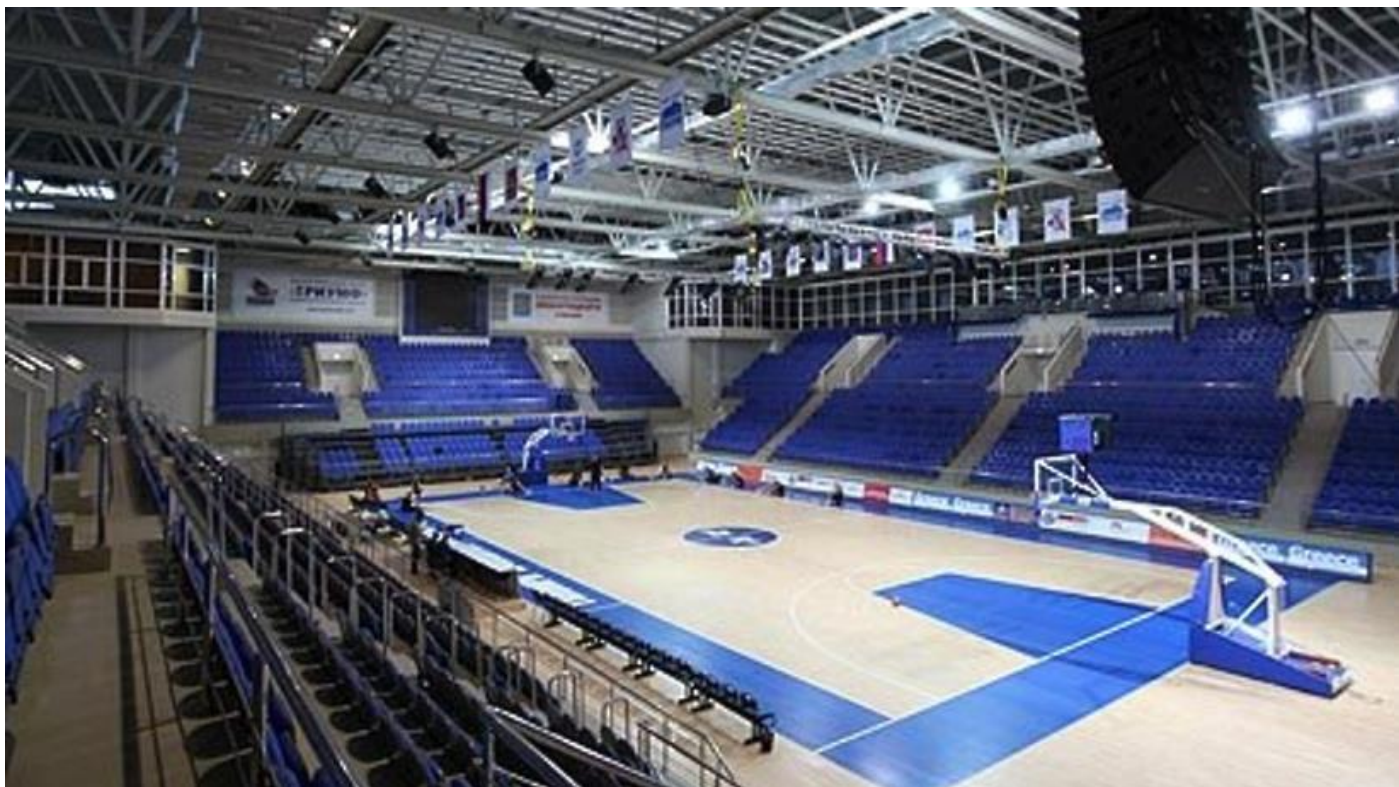
Расположение зрительских мест Дворца Спорта "Триумф"